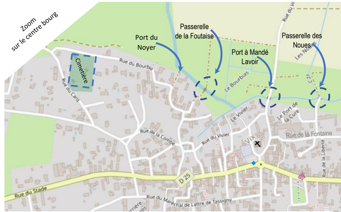
CIRCUIT 5 : « OZART », entre vignes et marais, créé par l'association Renc'Arts – Départ : place de Gaulle – 18 kms